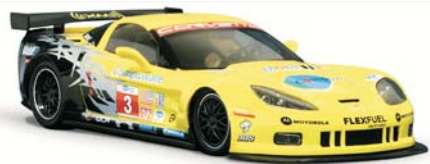
Corvette C6R GT2