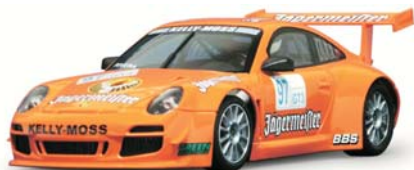
Porsche 997 GT3