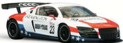
Audi R8 GT3