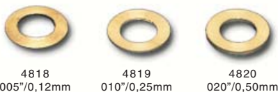
Pick-up guide spacer brass